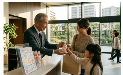
▲サンプリングイメージ