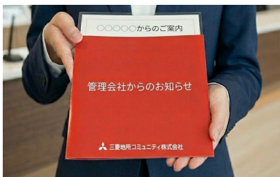
▲ターゲティングポスティングイメージ

今後は、住まい・子育て・見守り・健康・防災・余暇など幅広い分野で企業・団体との協業を推進し、北海道から沖縄まで全国をカバーする管理ネットワークを活かしながら、企業と居住者をつなぐ新たなマーケティングプラットフォームを提供いたします。