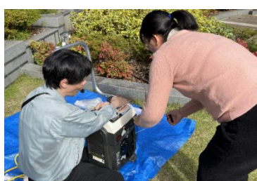
発電機の使用訓練