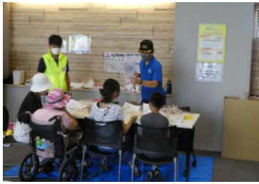
ワークワークショップ