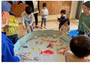
釣り堀で防災クイズ