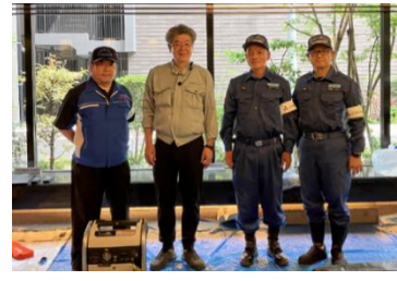
サポートスタッフ

阪神淡路大震災から 30 年、能登半島地震から 1 年を迎えましたが、南海トラフ地震や首都直下地震などいつ起きるかわからない災害に備えて、三菱地所コミュニティはマンションで在宅避難ができるよう防災を推進しております。本活動を含めマンションへの防災活動を通して、三菱地所グループと社会の持続可能性のテーマである「次世代に誇るまちのハードとソフトの追求」を推進し、地域社会へ貢献してまいります。