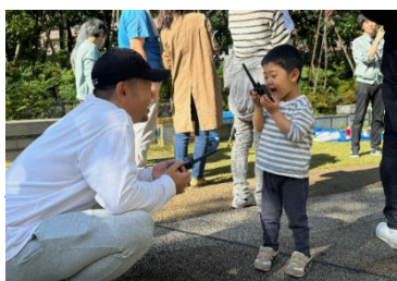
無線機で通話訓練

水消火器や身近なもので応急手当を行う訓練の他、行政で実施している地域防災の実績・ノウハウを活かしてお子さまも楽しめるプログラムを取り入れ、参加者を増やす工夫を行いながらマンションの防災訓練の活動を支援しています。