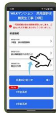
*スマートフォンの画面イメージ