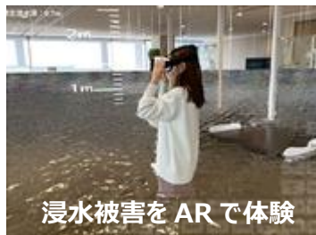
↑バーチャル浸水体験