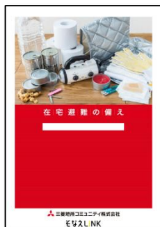
↑防災啓発リーフレット

また、自助のサポートとして「防災啓発リーフレットの提供」等、共助のサポートとして管理組合へ「訓練に役立つツールの提供」や「防災備品の提供・貸出」等が無償で実施いたします。