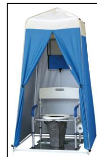
↑災害用マンホールトイレ (貸出)

“防災”と聞くと、なにか大変なことをしなければならないイメージがありますが、三菱地所コミュニティでは、防災について学びながらコミュニティ形成につながるような防災サービスを提供してまいります。