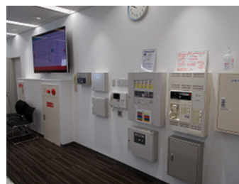
【トレーニングエリア】 設備ゾーン② 設備異常時の訓練