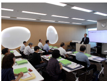
【レクチャーエリア】 研修の様子