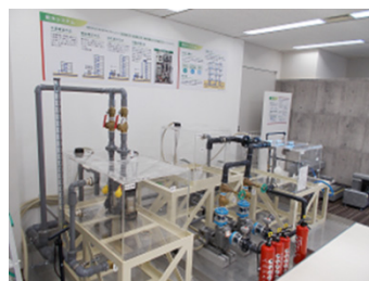
【トレーニングエリア】 設備ゾーン① 水槽の仕組み