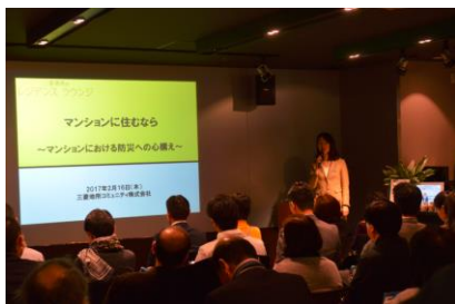
被災時における心構えを説明

■内容：東日本大震災時における実際のマンションの事例を基に、災害復旧工事までの大まかな流れや被災したことによる日常生活への影響について説明。