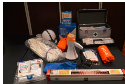
災害時に使用するアイテム一例